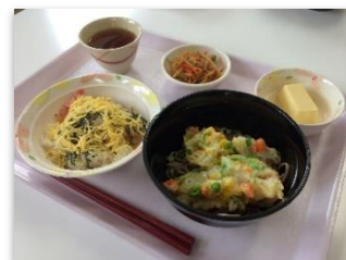
毎日温かい食事を提供