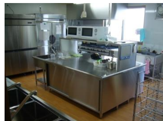
本格的な厨房を設置