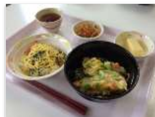
毎日温かい食事を提供