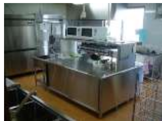
本格的な厨房を設置