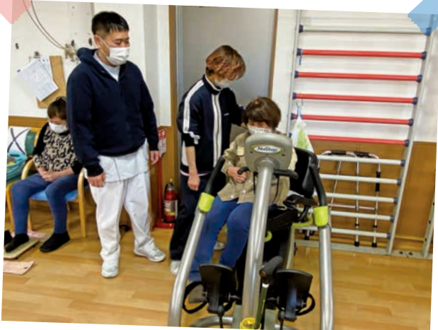
リハビリスタッフが、その方の状態・目的に応じてメニュー作成