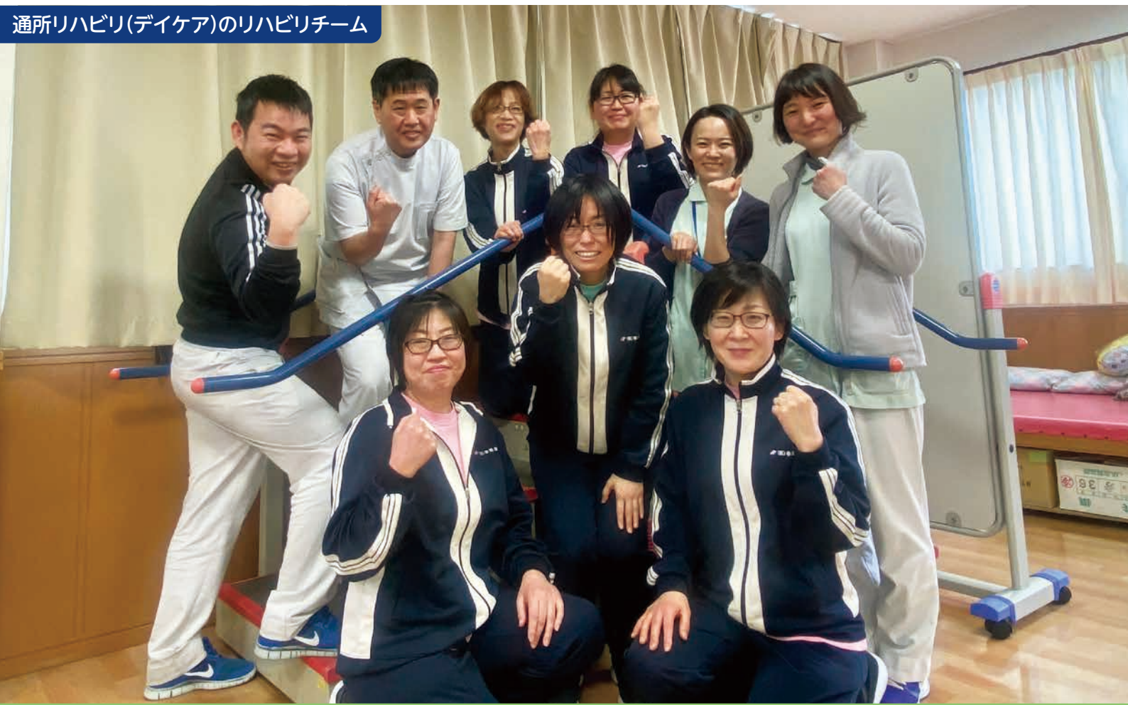
通所リハビリ(デイケア)のリハビリチーム

新型コロナ(オミクロン株)感染対策について (Ver.11) に改定いたしました。