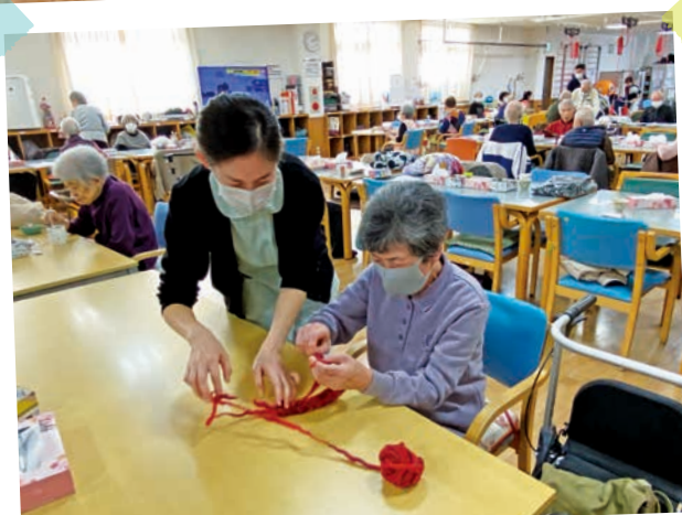
手指運動の為の作業療法の様子