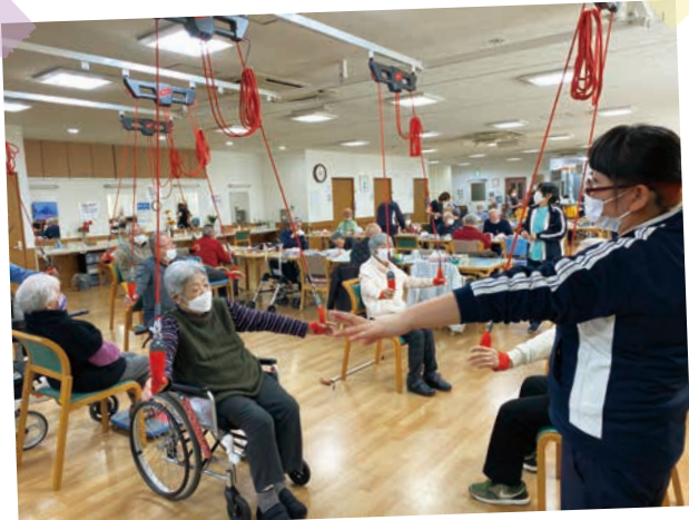
運動指導員によるレッドコード運動