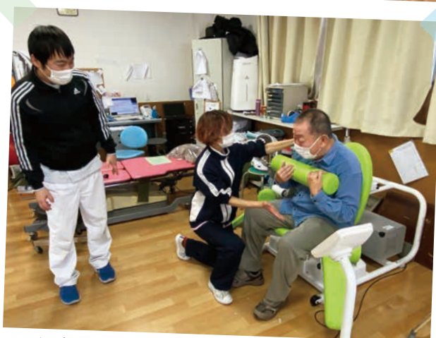
効率・効果的な運動ができるようサポート