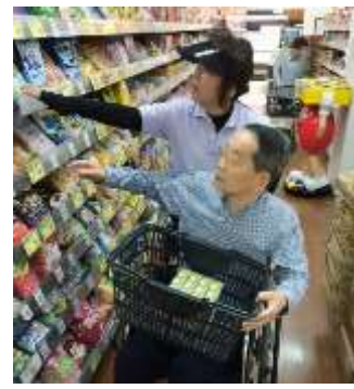
ヘルパーさんと一緒にお掃除・洗濯を行います