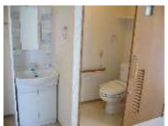
トイレ・洗面台完備