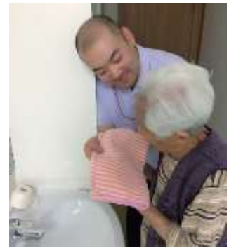
朝食後には、お風呂タイム!