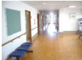
明るくて広い廊下