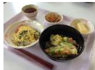
毎日温かい食事を提供