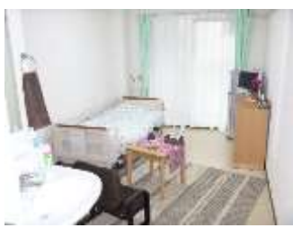
居室 (モデルルーム)

1ルーム (18㎡) ・冷暖房・トイレ・洗面台 照明器具・ナースコール・クローゼット・ベランダ