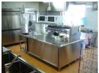
本格的な厨房を設置